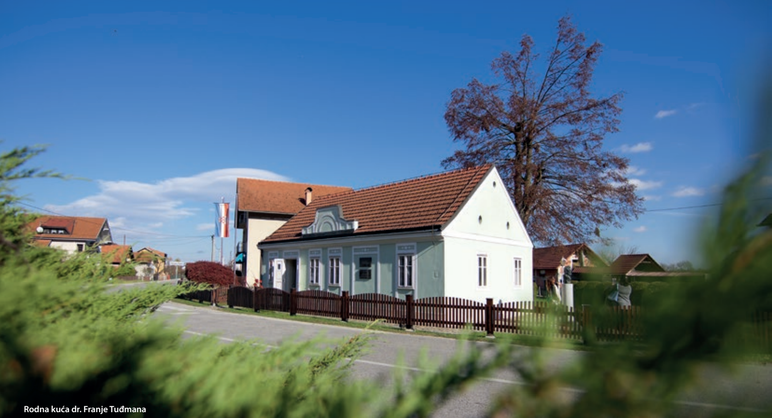
Rodna kuća dr. Franje Tuđmana