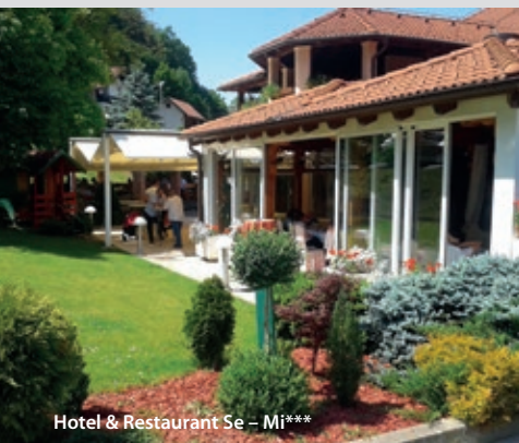
Hotel & Restaurant Se – Mj***

Dražesno mjesto po mjeri obitelji, prvi put se spominje početkom 16. stoljeća. Smješteno na ulazu u Krapinsko-zagorsku županiju iz smjera Zagreba, uz obalu rijeke Krapine, odlično je prometno povezano s glavnim gradom Hrvatske i ostalim središtima Europe. Mjesto se kroz povijest širilo i razvijalo uz izgradnju ceste i kasnije uz izgradnju željezničke pruge. Svakako valja istaknuti da je na tom području kod crkve u Velikoj Erpenji osnovana i najstarija škola na ondašnjem Balkanu! Veliko Trgovišće rodno je mjesto prvog hrvatskog predsjednika, dr. Franje Tuđmana.