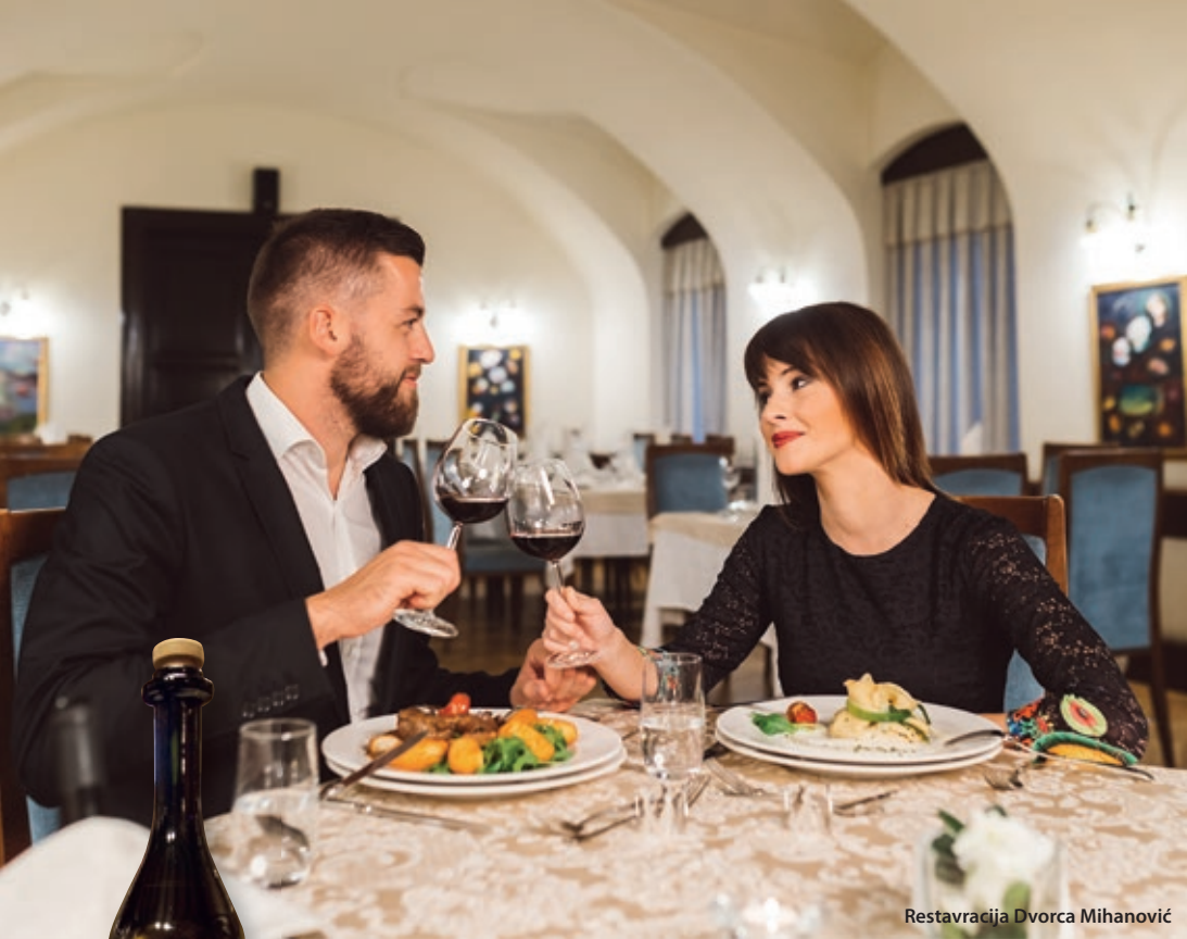
Restavracija Dvorca Mihanović