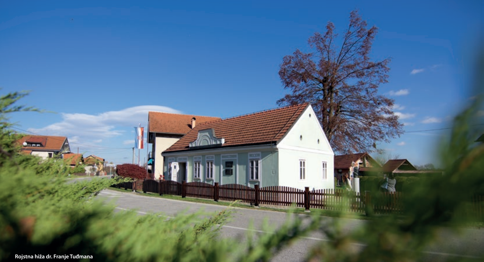
Rojstna hiša dr. Franje Tuđmana