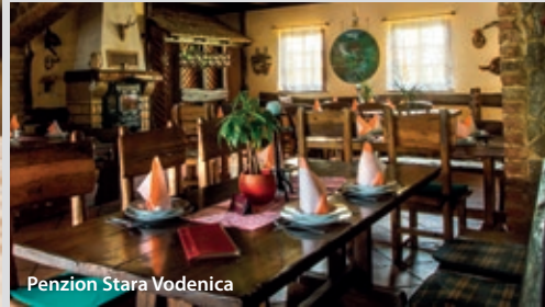
Penzion Stara Vodenica