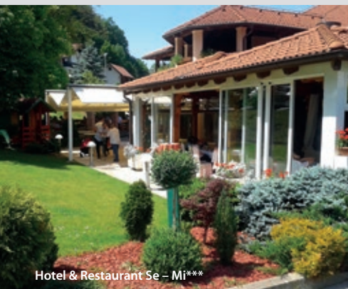
Hotel & Restaurant Se – Mj***

Simpatično družinam prijazno mesto je bilo prvič omenjeno v začetku 16. stoletja. Nahaja se na vhodu v Krapinsko-zagorsko občino iz smeri Zagreba, ob bregu reke Krapine in je dobro povezano s prestolnico Hrvaške in drugimi središči Evrope. Skozi zgodovino se je mesto širilo in razvijalo z izgradnjo ceste in kasneje z izgradnjo železnice. Omeniti velja, da je bila na območju cerkve v naselju Velika Erpenja ustanovljena tudi najstarejša šola na Balkanu tistega časa! Veliko Trgovišće je rojstni kraj prvega hrvaškega predsednika dr. Franja Tuđmana.